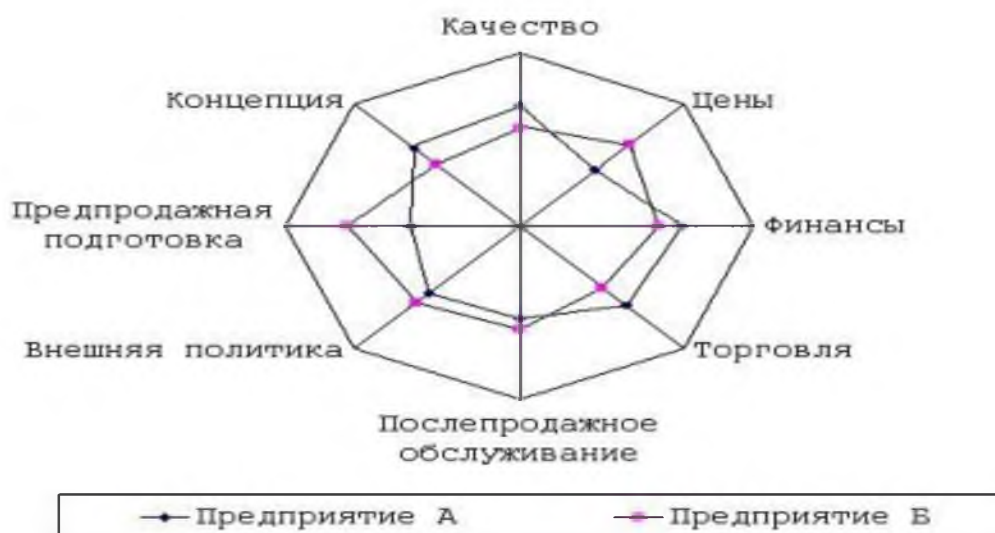
Рисунок 1 - Многоугольник конкурентоспособности [2, с. 45]